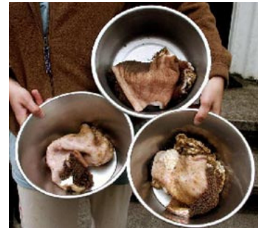
Drei Portionen frischer Pansen für große Hunde.

Einmal in der Woche kann ein fleischfreier Tag eingelegt werden. Das Fleisch sollte möglichst in ganzen Stücken gefüttert werden. Knochen immer nur zusammen mit einem größeren Fleischanteil (= mehr Fleisch als Knochen) füttern, damit die nötige Magensäure zur Verdauung der Knochen produziert wird. Die Magensäfte des Hundes können Knochen, Knorpel und Fleisch problemlos verdauen.