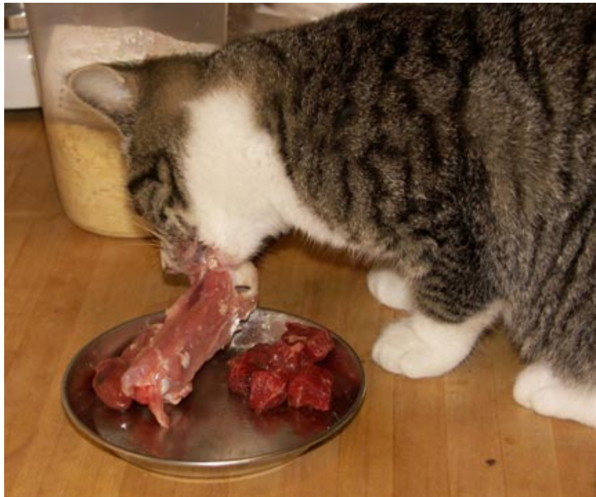
Eine junge Hauskatze, die schon von klein an verschiedenste Nahrungsmittel gewöhnt ist, nagt an einem Hähnchenschenkel.

Auch Katzen sind Fleischfresser und leben mit Rohfutter erheblich gesünder. Allerdings sind die zu beachtenden Punkte bei Katzen anders gelagert, denn die Katze hat ganz andere Nahrungsgewohnheiten als der Hund. Grundsätzlich ist es erheblich schwieriger, Katzen roh zu füttern, als Hunde. Hier die wichtigsten Unterschiede zu Hunden: