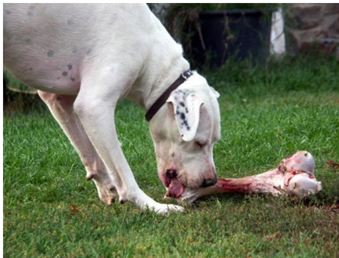
Ein Dogo-Argentino bei seiner Lieblingsbeschäftigung

Der Hund ist ein Jäger und Aasfresser. Vergleicht man den Hund mit anderen Säugetieren, so ist schon rein äußerlich nicht zu übersehen, dass er zum Jagen und Beute machen geschaffen ist. Seine Anatomie (sofern sie nicht durch massive Zuchteingriffe der Menschen degeneriert ist) ist auf das Aufspüren von Beute und schnelles und langes Hetz-Jagen spezialisiert. Rinder und Schafe z.B. sind gar nicht für schnelle Bewegungen (außer kurzfristigem Herden-Flüchten) geschaffen. Katzen, die eher Lauer-Jäger sind, können keine längeren Strecken in hohem Tempo zurücklegen.